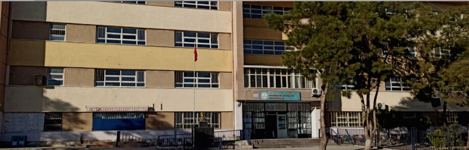
HÜSNÜ M. ÖZYEĞİN ORTAOKULU