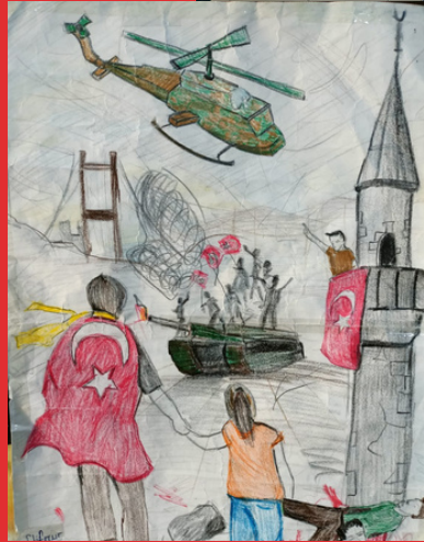
Elif Nur AKBULUT 7-C Sınıfı