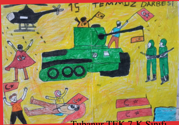
Tubanur TEK 7-K Sınıfı