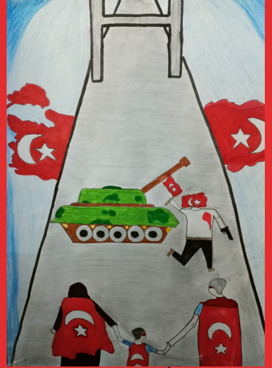
Emine EL HAC 8-İ Sınıfı

Görsel Sanatlar Öğretmeni İrfan TURFAN rehberliğinde okulumuz öğrencileri tarafından yapılan çalışmalar.