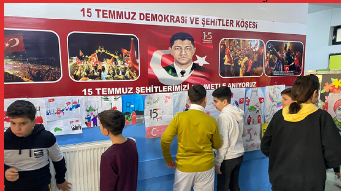
HÜSNÜ M. ÖZYEGİN ORTAOKULU