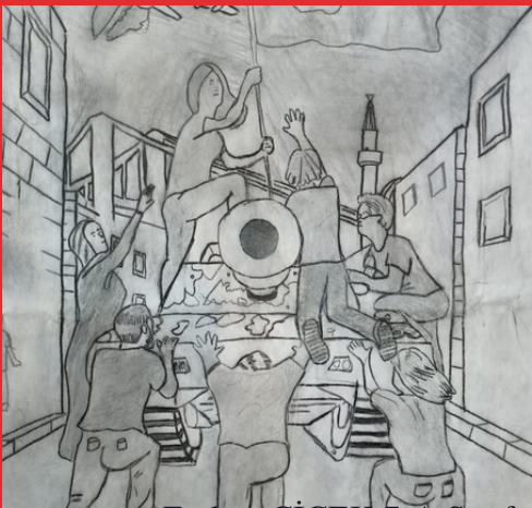
Furkan ÇİÇEK 7-A Sınıfı